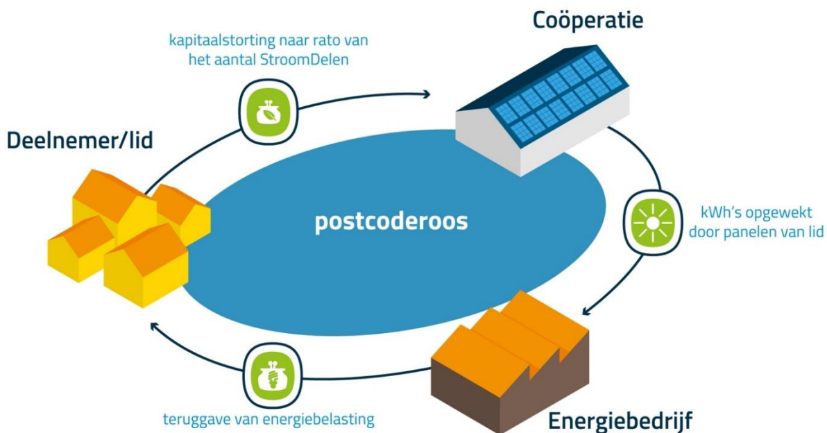
Afbeelding: Postcoderoosregeling in beeld